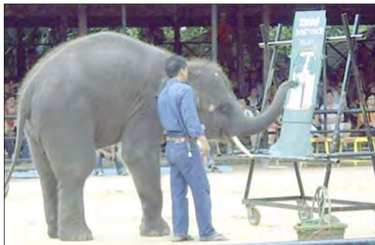
Одна из участниц знаменитого шоу слонов – эта художница, рисующая хоботом