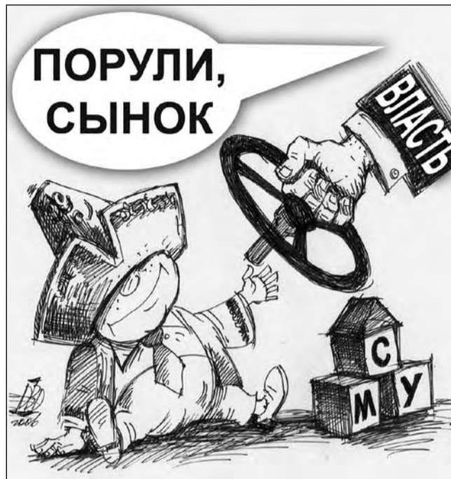
Карикатура Батырбека ДЖУЗБАЕВА

размер определяется четкой формулой в зависимости от количества учащихся, учителей и классов.