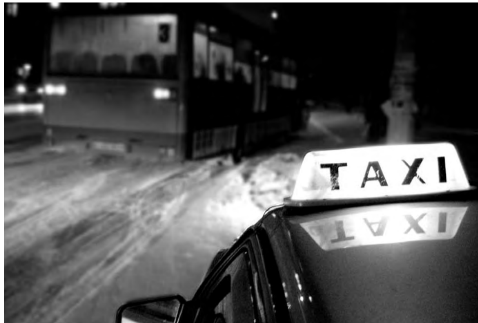
Такси в Костаное вне закона