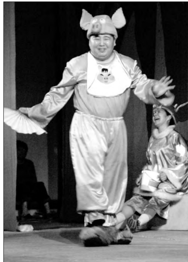
Эпизод из спектакля «Незнайка на Луне»

Завершится фестиваль награждением лучших на грандиозном гала-концерте 8 ноября.