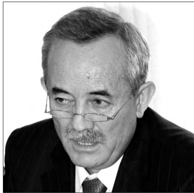
Серик АБДРАХМАНОВ, депутат Мажилиса Парламента РК:

– Я думаю, нам надо постараться убедить Нуреке (Нурсултан Назарбаев, президент РК - Т.Г.). Если убедим Нуреке, значит, закон будет принят.