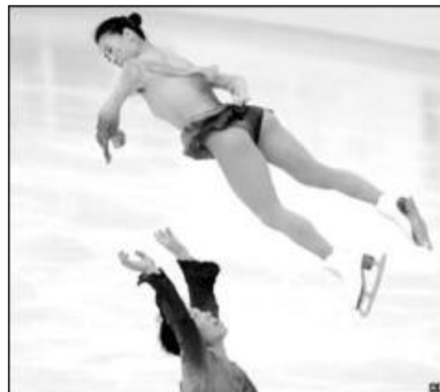
В Нанкине (Китай) проходят соревнования по фигурному катанию