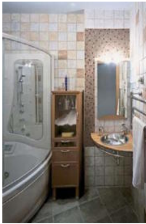
Общая для всей квартиры цветовая гамма не меняется и в ванной комнате. Стена возле раковины дополнительно подчеркнута отделкой: вместо обычной керамической плитки здесь наклеена мозаичная

самый укромный уголок жилища, дополнительно прикрыт витражами холла. Для создания здесь ощущения простора применен зеркальный потолок, словно уносящийся ввысь. В оформлении детской заложена возможность развития интерьера по мере роста ребёнка (сейчас ему два года). Помимо дивана, малышу предусмотрено ещё одно «спальное место» - палатка, с успехом заменяющая всю традиционную мебель. А в спальне мебели как будто и вовсе нет. Не кровать, а матрас на подиуме. Не шкаф, а