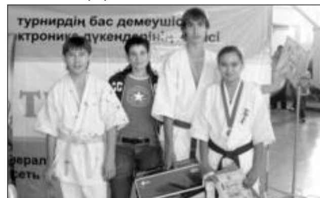
Костанайские призеры первенства РК по шинкиокушинкай