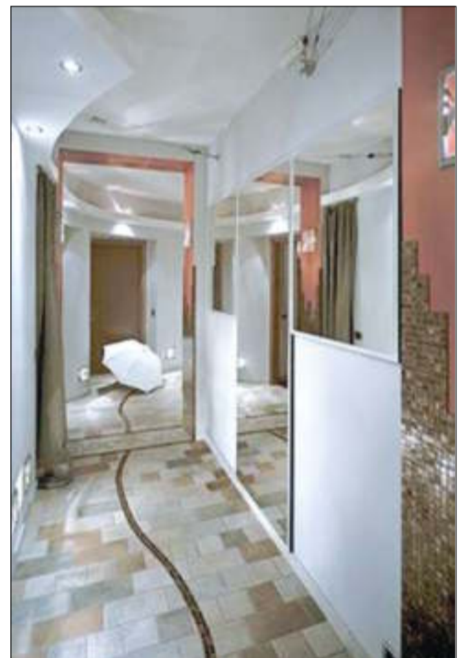
Вместо унылой «кишки» коридора архитекторам удалось создать пространство, наделенное необычными свойствами. Зеркала и волнистая линия на полу зрительно раздвигают стены и даже как будто слегка их изгибают

Количество комнат - 4 Высота потолка - 2,8 м