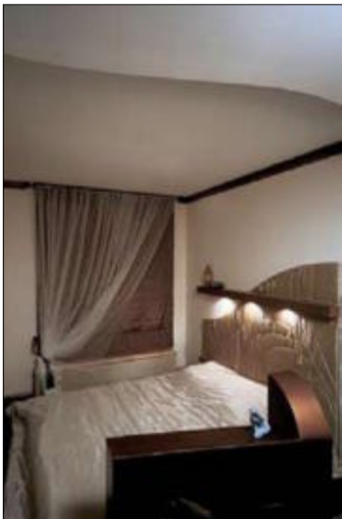
Ночь. Спальня. Три лампочки. В неярком электрическом свете цвет атласных драпировок кажется более насыщенным, тёплым

самый укромный уголок жилища, дополнительно прикрыт витражами холла. Для создания здесь ощущения простора применен зеркальный потолок, словно уносящийся ввысь. В оформлении детской заложена возможность развития интерьера по мере роста ребёнка (сейчас ему два года). Помимо дивана, малышу предусмотрено ещё одно «спальное место» - палатка, с успехом заменяющая всю традиционную мебель. А в спальне мебели как будто и вовсе нет. Не кровать, а матрас на подиуме. Не шкаф, а