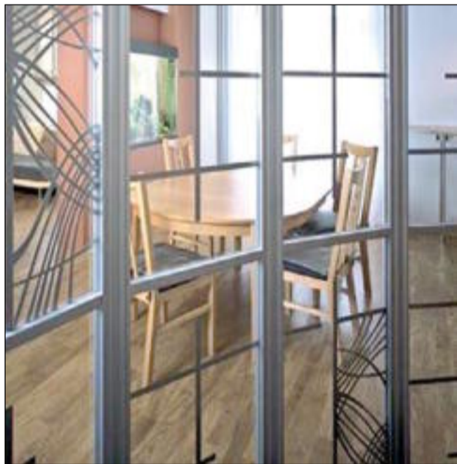
Стеклопанельная перегородка с тонкими металлическими переплётами отделяет проход в ванную от парадной обеденной зоны

ное. «Не верь глазам своим...» Это даже и не плавно перетекающие друг в друга помещения, а