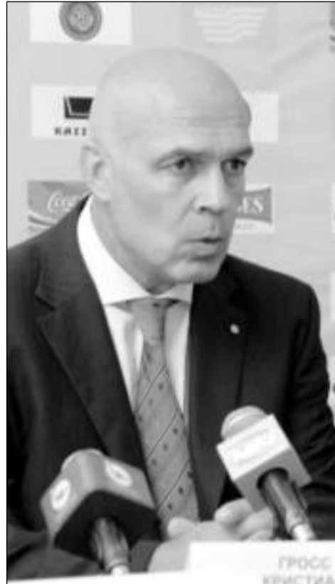
Кристиан Гросс: «В чемпионате Швейцарии по уровню игры «Тобол» бы входил в шестёрку-восьмёрку лучших футбольных клубов»