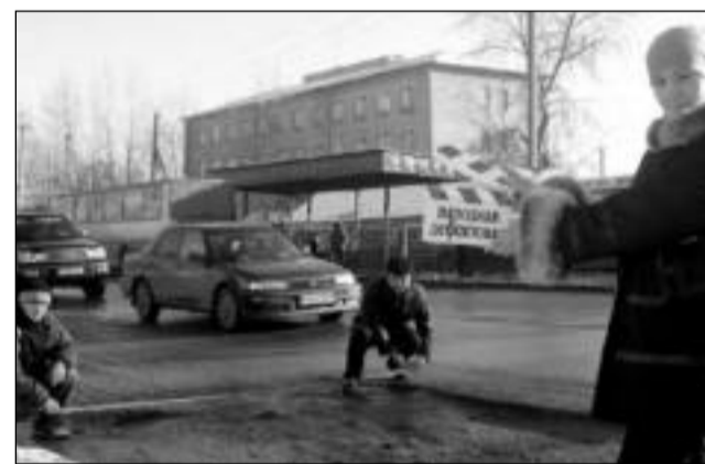
Костанай. Улица Мауленова. Остановка «Дом печати»

«Автосалон» продолжает тему, предложенную читателями. Все, кого возмущает качество наших дорог, по-прежнему могут позвонить в редакцию и назвать самые жуткие ямы и другие дорожные дефекты населенных пунктов области поименно. Мы сфотографируем их, а затем и издадим «Народную дефектовку» отдельной брошюрой. Получится милый подарок ответственным за состояние дорог лицам.