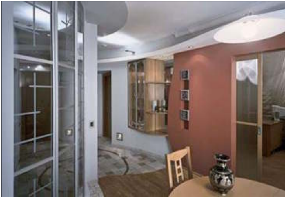
Интерьер строится на контрасте светло-серого фоновых оттенков и терракотовых акцентов. Дополняют картину авторские стеклянные элементы: перегородка и небольшие витражные вставки на стенах

Вторая часть квартиры - приватная, скрытая - состоит из спальни, детской и санузла. Все три помещения максимально обособлены от остальной квартиры. Санузел, «загнанный» в