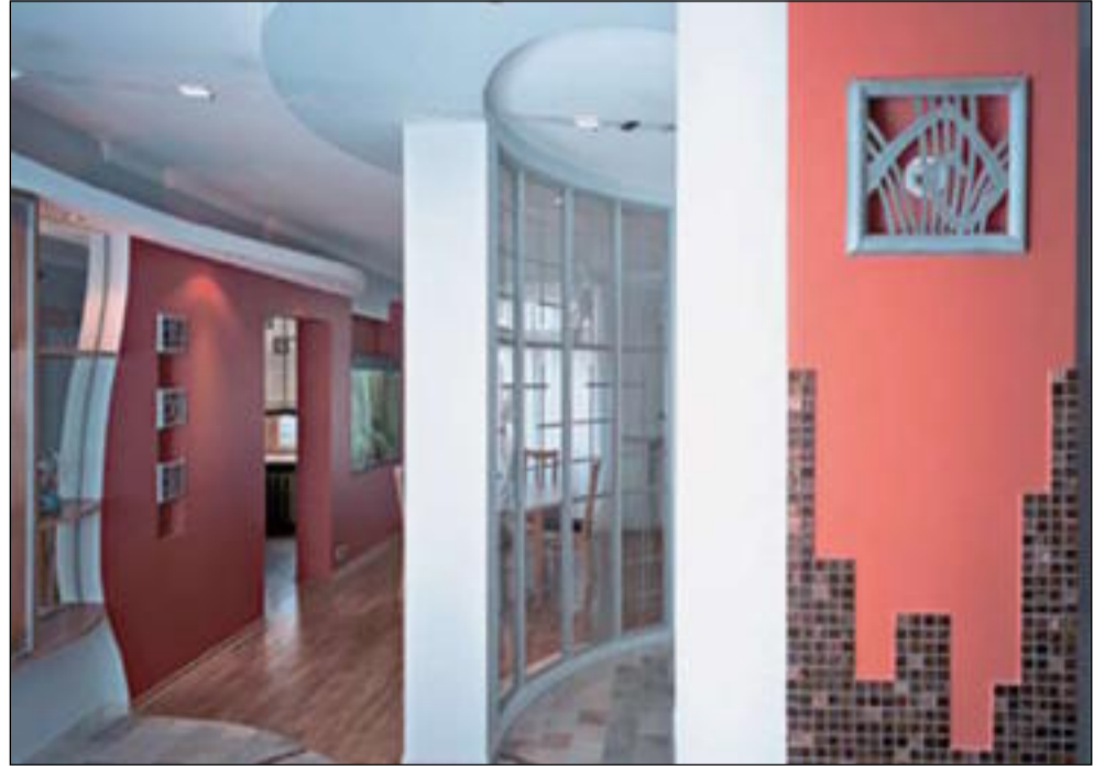
Подобно ракушке разворачивается пространство парадной половины квартиры. Из одного помещения можно попасть сразу в семь

Но, как известно, иногда стены можно раздвинуть не ломом, а волшебным приемом. К нему архитекторы и прибегли. Извилистые линии пола и потолка заставляют вас поверить, что коридор уходит в бес-