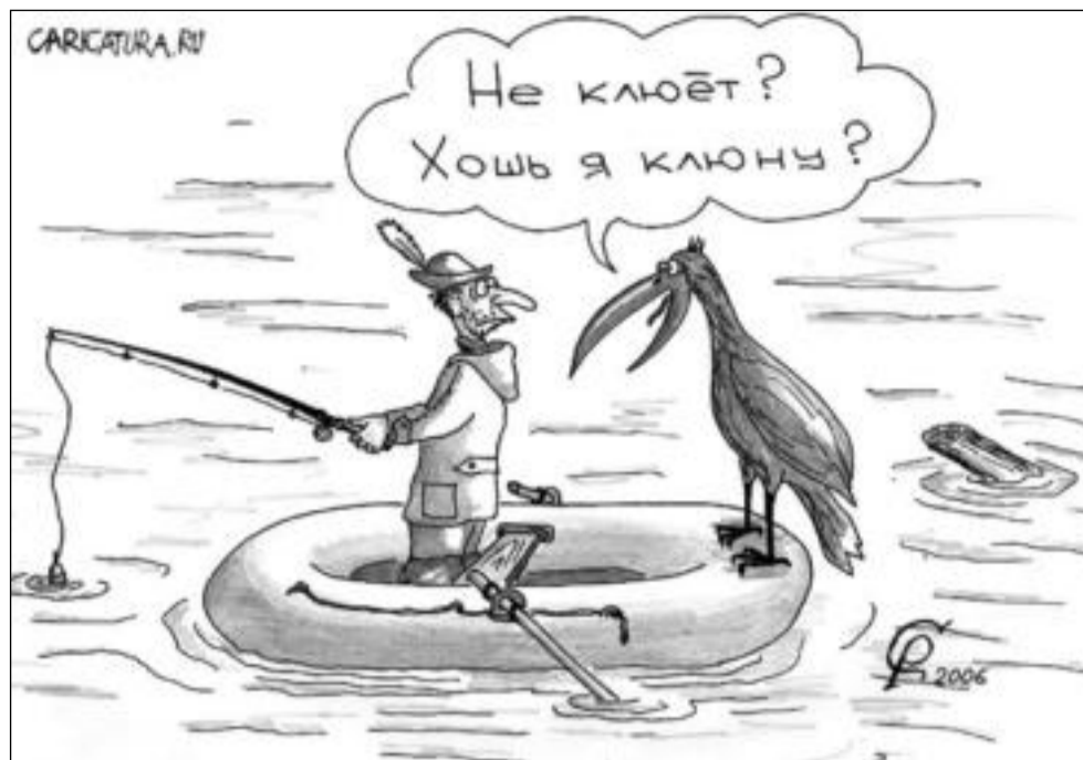
Клёв (карикатура Романа Серебрякова)