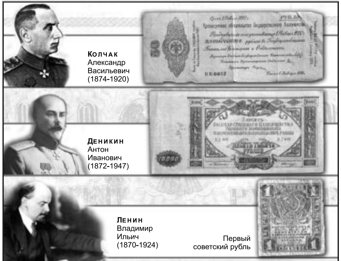
Деньги начала 20 века были размером от почтовой марки до альбомной страницы Купюры предоставлены областным краеведческим музеем.

1920 года составил 20 100 рублей. Из Челябинского губфинотдела в период с 1 января по 31 марта 1920-го года было прислано 70 000 000 рублей, выпущено в народное обращение 81 328 000 руб. Но были и свои сложности.