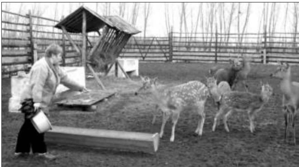
Любимое лакомство оленей - картофельные очистки

«Мы поедем, мы помчимся на оленях утром ранним...» Вот и я помчалась стремглав, как только узнала, что неподалёку от пригородного поселка Мичурино живут настоящие олени.