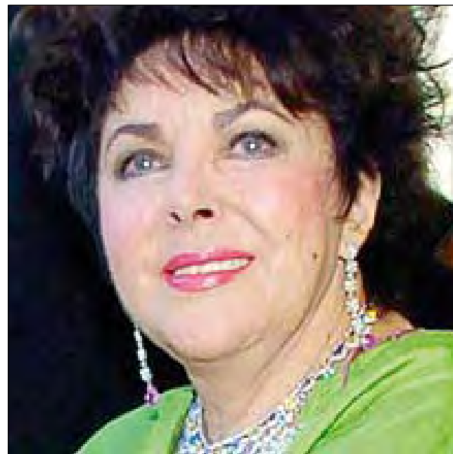
Элизабет Тэйлор собирается замуж девятый раз