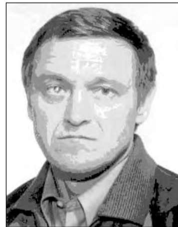
«Вот уже 3 месяца, как от папы нет известий!»