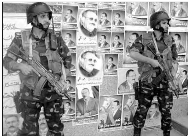
Йеменский спецназ обеспечивает порядок в столице страны Сане накануне президентских выборов