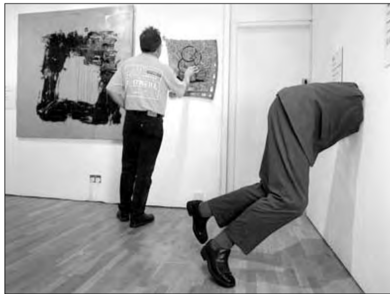
В Лондоне проходит художественная выставка «Чувство и чувственность». Разные художники чувственность понимают по-разному