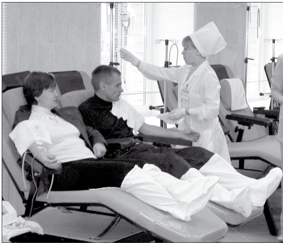
Несмотря на поиск искусственных заменителей, медицина ещё долго не сможет обходиться без донорской крови