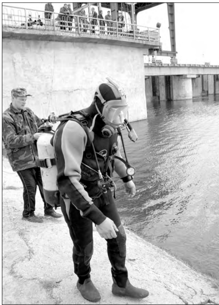
Водолазы приступили к обследованию подводной части гидроузла