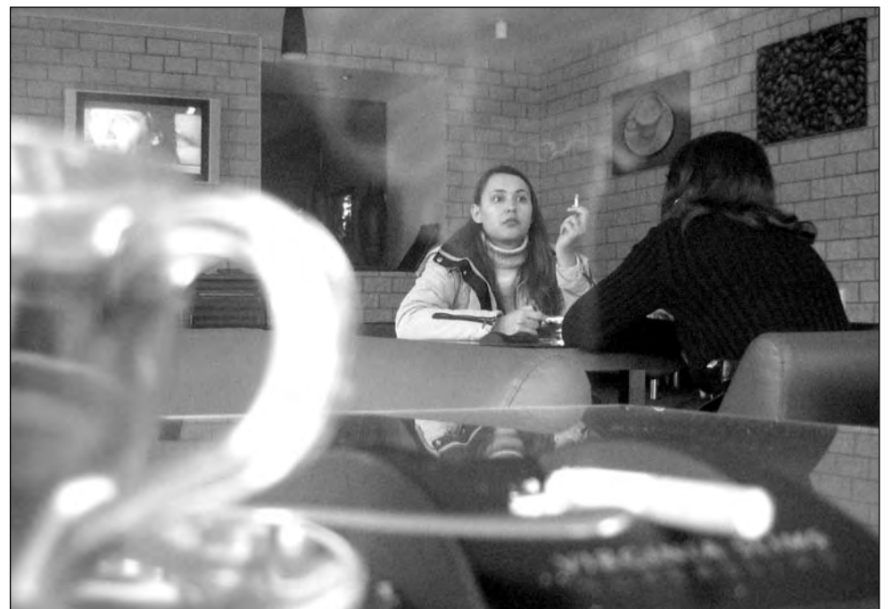
В «Кофейне» курящие сидят отдельно, но дышат дымом все

– Если у вас разрешено курение, то почему в таком случае не висят объявления «У нас курят»? – поинтересовалась я. И немедленно была вежливо отправлена к администратору заведения, представителя которой в этот мо-