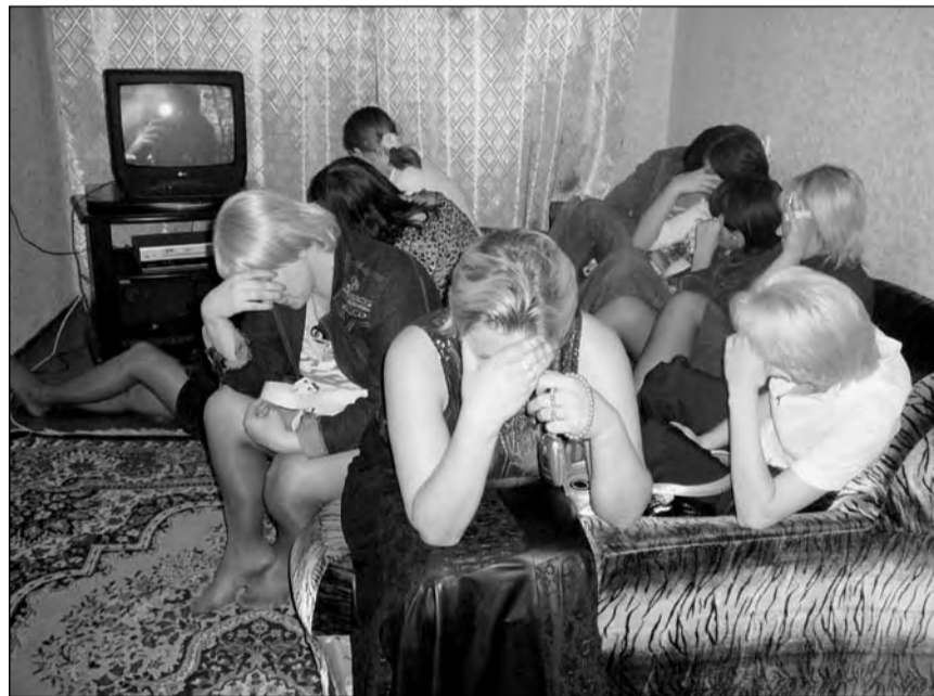
В сети УБОПа во время рейда попало 14 проституток.

Сотрудники управления по борьбе с организованной преступностью ДВД задержали 14 девушек, занимающихся проституцией. Как сообщает пресс-служба ДВД, рейд против явления, за которое в нашем Уголовном кодексе наказания нет, прошёл в ночь с 16 на 17 сентября. Полицейские провели операцию на заранее снятой квартире, куда проститутки вызывали по телефону.