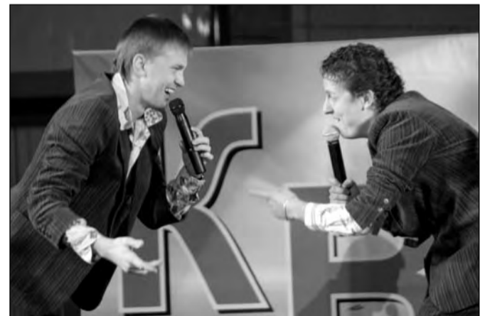
«Разборки по-деревенски» в исполнении команды «ЛУНА»

- Трудно ли провинциальным командам добиться