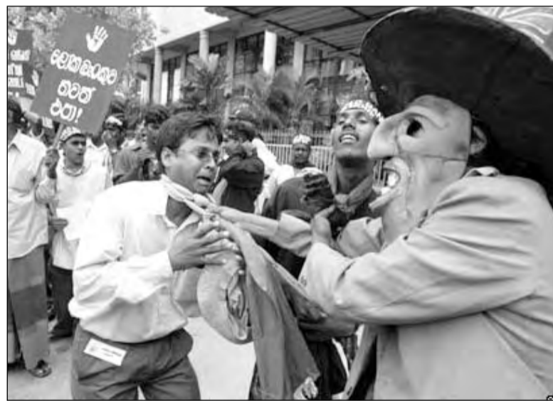
Уличный спектакль в Коломбо (Шри-Ланка), критикующий Всемирный банк и Международный валютный фонд