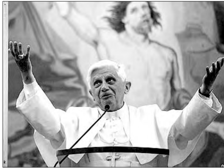
У Папы Римского был тяжелый день - пришлось объяснить мусульманам смысл недавней речи