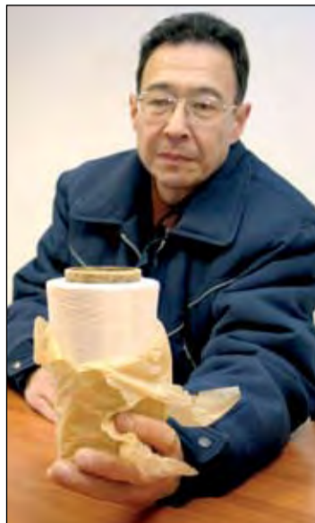
Эта катушка метаарамидной нити была выпущена в Костане в мае 1992 года. Новая продукция будет по виду такой же, но гораздо качественнее

Пока люди работают в одну смену, но в перспективе производственный процесс должен протекать круглосуточно. Процесс синтеза нити – вещь хрупкая, если остановить прядильные машины, то их повторный запуск потребует мно-