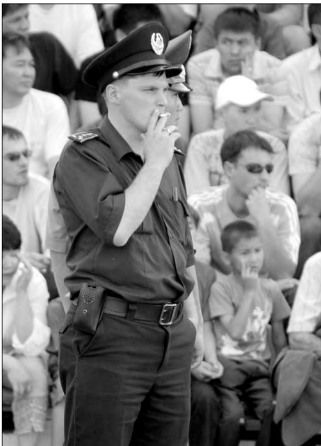
Полиция, к которой советуют обращаться за помощью, пока сама нарушает закон на спортивной арене