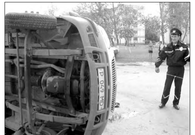
После столкновения «Газель» перевернулась на бок

этого на месте «Газели» лежал на боку «пирожковоз», тоже, кстати, грузённый хлебом и не сумевший разбёхаться с другим автомобилем. А ещё несколькими днями раньше на перекрёстке столкнулись две легковушки. Что же это за место такое странное?