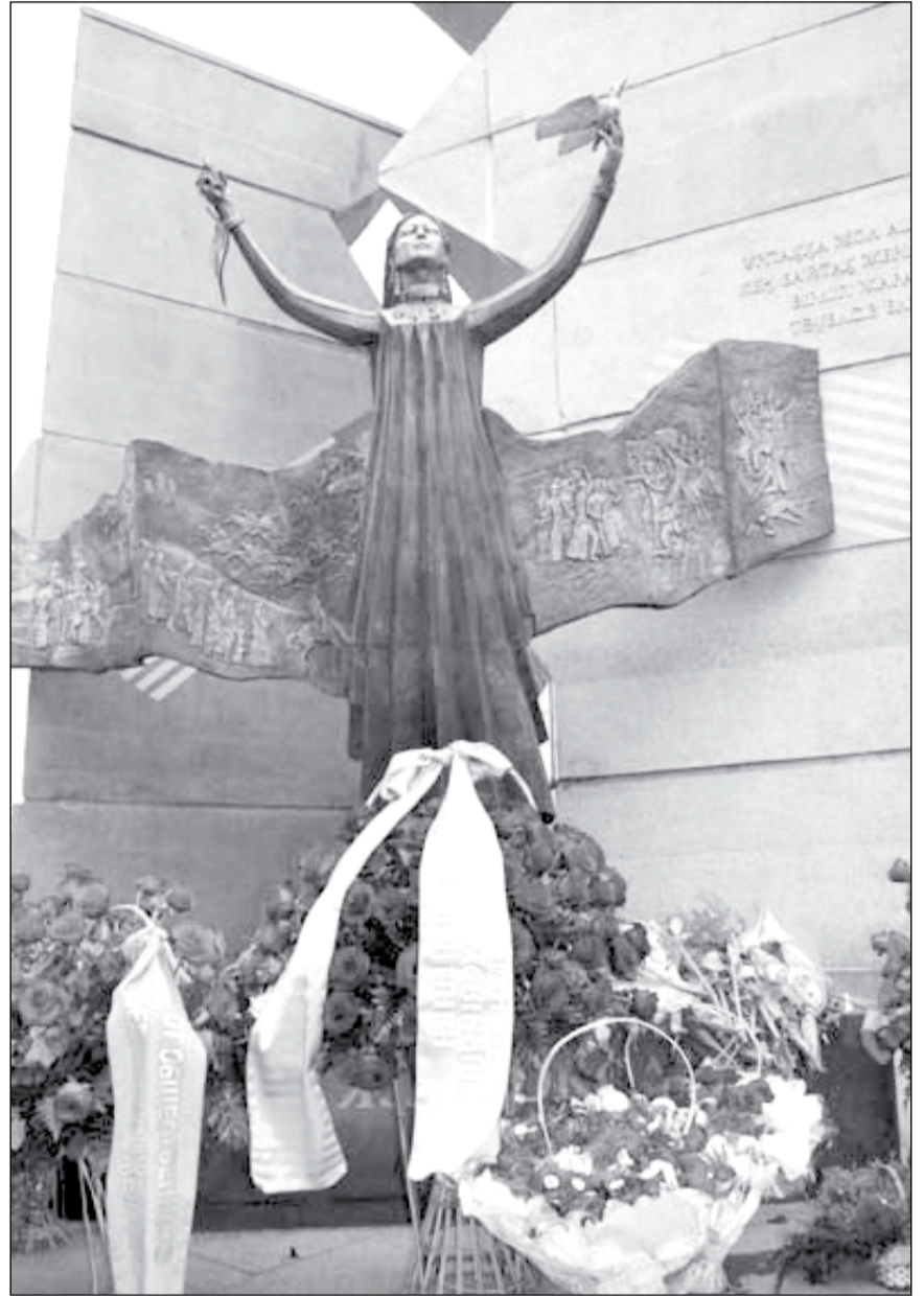
На возведение монумента «Рассвет свободы», открытого со второй попытки, потратили более 176 млн. тенге

- Декабрьское событие, которое вывело молодежь на площадь, было предвестником нашей независимости, ска-