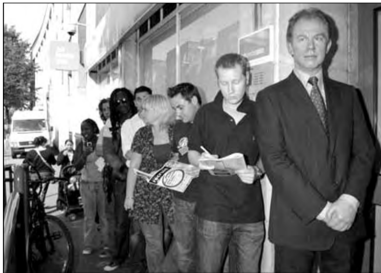
Восковая фигура британского премьер-министра Тони Блэра в очереди на биржу труда. Тонкий намек на то, что он может скоро остаться без работы