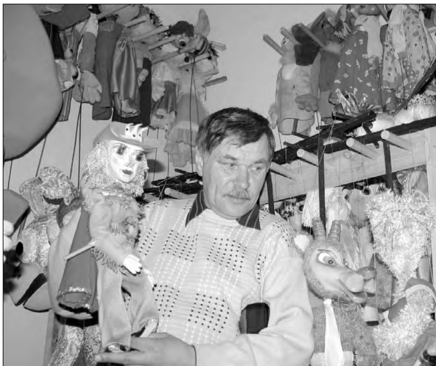
Режиссер Геннадий Иванов с главной героиней гастролей