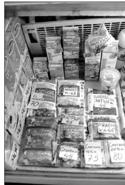
Литр молока от фирмы «ДЕП» подорожал на 10 тенге