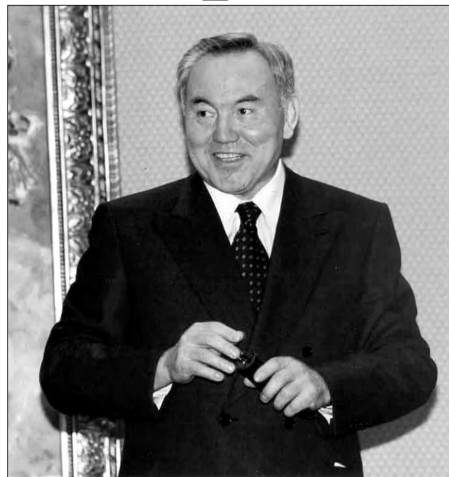
Долгожданный визит в США может поставить Нурсултана Назарбаева перед нелёгким выбором: либо реальные демократические реформы во внутренней политике, либо уступка интересам США в политике внешней

Кстати, и президент США на саммите «восьмёрки», который летом прошёл в Санкт-Петербурге, тоже заявил о праве разных стран самим выбирать свой путь движения к демократии. То есть налицо изменение позиции администрации Белого дома относительно сроков и способов проведения демократических реформ в странах азиатского континента. Но ведь Америка уже обжигалась по этому поводу во Вьетнаме. Выходит так, что там по-новому проходят ту же науку? Что-то на американцев это не похоже. Неужели опять нужно было споткнуться в Ираке, испытать глубокие разочарования итогами различных «цветных» революций на постсоветском пространстве, чтобы там взяли верх «реалисты»? Возможно, так оно и есть, но смущает одно обстоятельство. Когда ту же Эли-