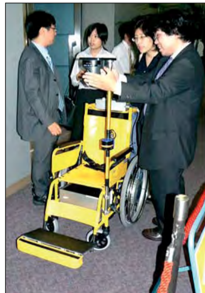
С таким креслом-поводырем более комфортно

В Японии представили роботизированные кресла-коляски. Одно из них, названное Pupil, предназначено для упрощения жизни слепых людей. Pupil имеет настраиваемое сиденье, которое можно убрать, чтобы избежать повреждений, и которое подстраивается под рост сидящего в нем человека. Устройство для обработки изображения маршрута кресла-коляски таким образом, чтобы избежать препятствия по дороге, и при этом использует специальные коды для определения местоположения. Pupil будет доступен в Японии уже в этом году по цене $ 17 000.