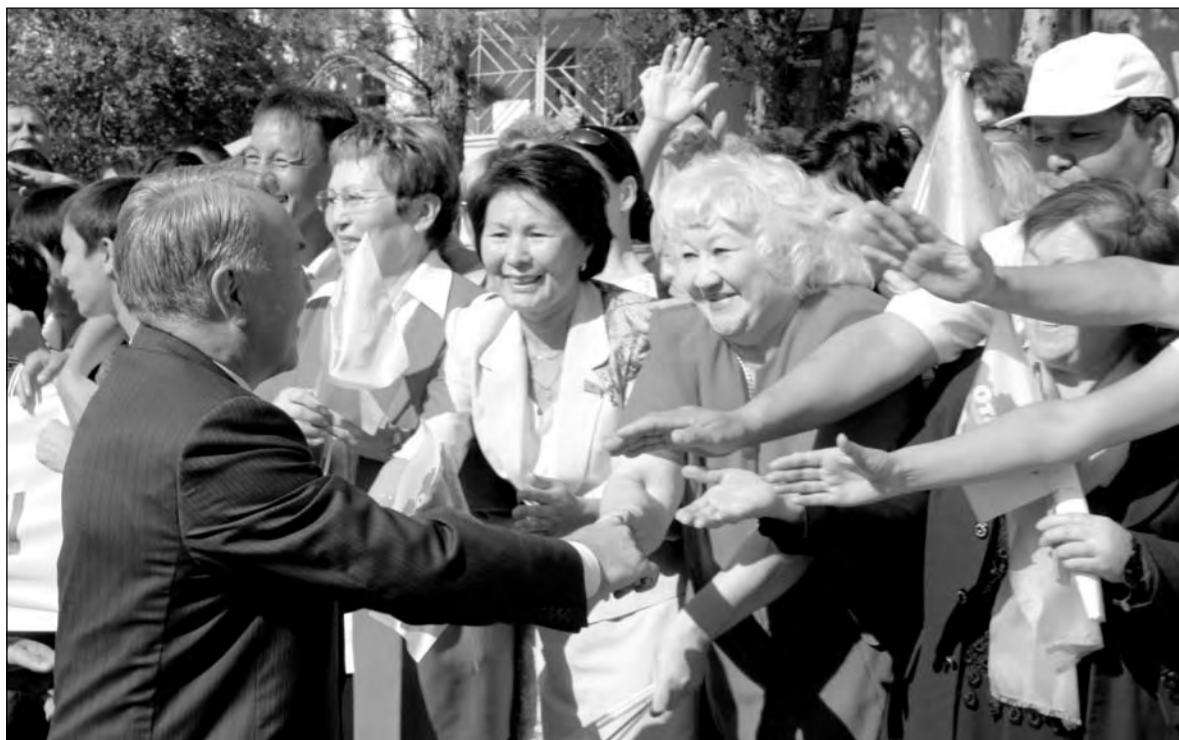
Пожать руку президенту стремились все собравшиеся

– Уважение к высокому гостю у нас превращается в чистой воды холуйство. Город вылизывают, народ за неделю заставляют репетировать прием. Держать детишек на стадионе в самую жару, вытаскивать студентов на улицу и держать их там несколько часов – это глумление над людьми. Из президента у нас делают небожителя, и я чувствую, что ему это нравится. В противном случае президент давно бы, посмотрев на это дело, поинтересовался: а сколько времени народ тут простоял, отправил бы их домой, потому что нет в этом необходимости.