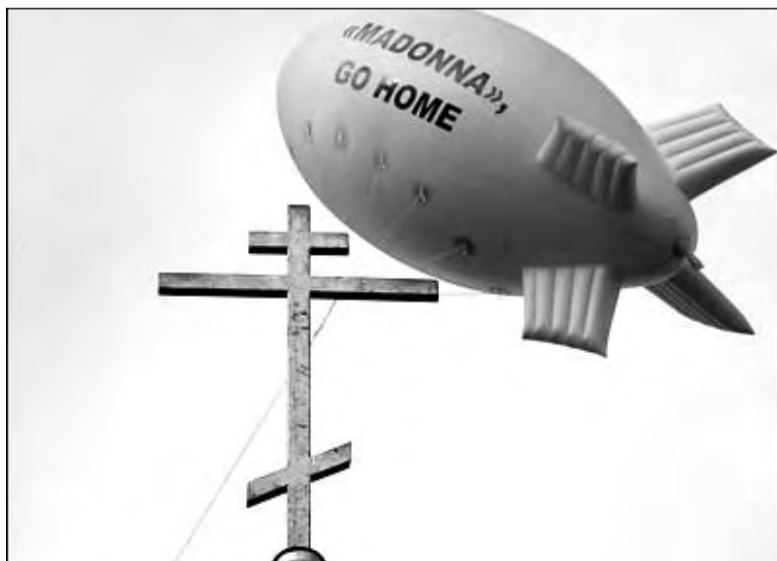
Члены движения православной молодежи «Георгиевцы» запустили воздушный шар с надписью «Мадонна, убирайся домой» накануне ее концерта