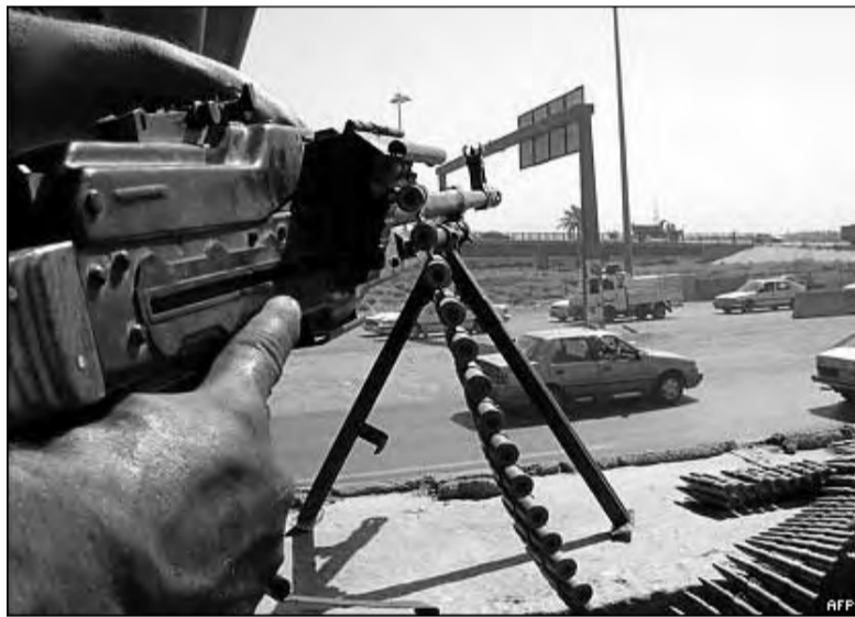
Возглавляемая США международная коалиция передала контроль над вооруженными силами Ирака премьер-министру страны