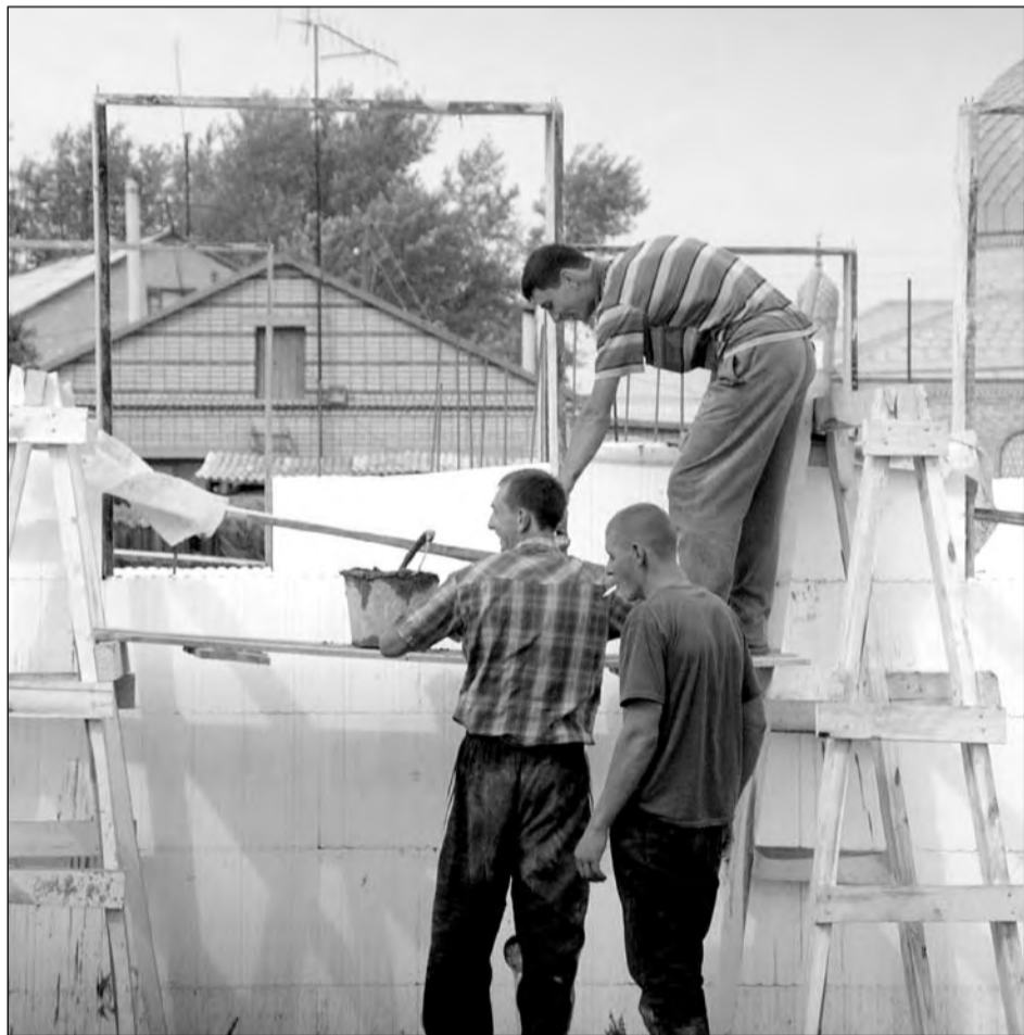
Новый подрядчик в Сарыколе должен возвести два жилых дома до начала декабря