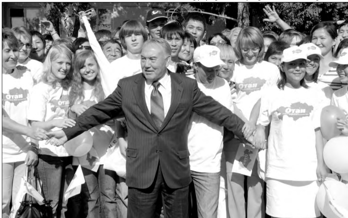
За широкой спиной президента