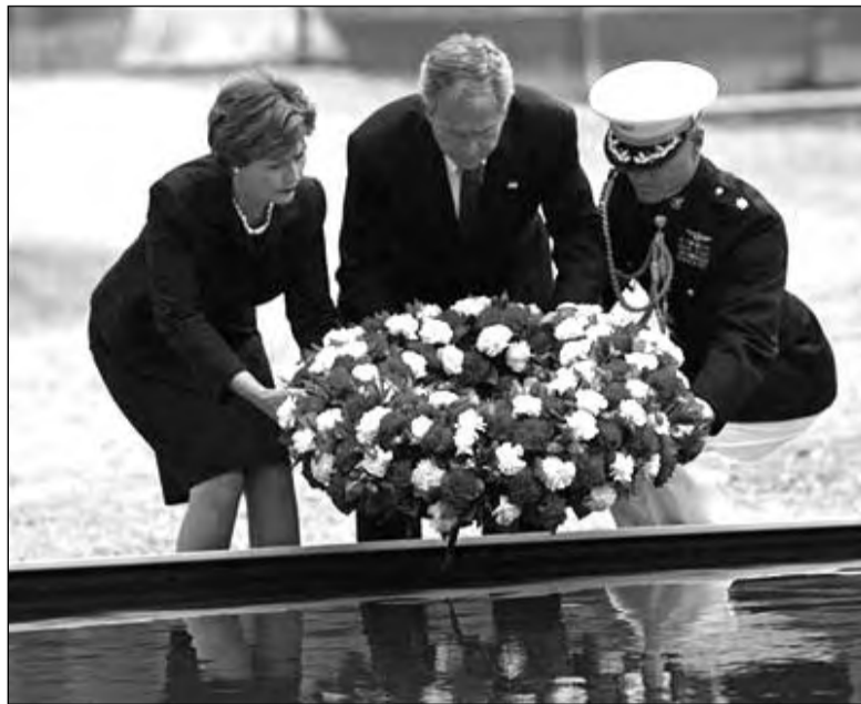
Джордж и Лора Буш прибыли в Нью-Йорк и возложили венок к месту, где раньше стояли башни-близнецы