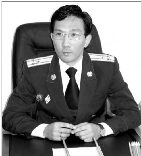
А. Алимов: «Имя чиновника, разбившего машину, не называю в интересах следствия»

Криминал, коррупция, защита прав граждан. Обычно на конференциях прокуроры придерживаются такой канвы. По каждому из этих пунктов Алимову было что сказать. Один из самых «горячих» фактов – возбуждение 21 августа уголовного дела в отношении одного из руководителей городских департаментов. За то, что пользовался служебной машиной в личных целях, разбил ее, поставил в укромное место и... «умыл руки». Почти год авто, купленное на бюджетные деньги, как бы и не существовало. Сейчас выяснено, что «Ауди» восстановлению не подлежит.