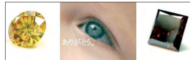
Бриллианты из детских волос – для продвинутых родителей

Российская компания New Age Diamonds, специализирующаяся на изготовлении синтетических алмазов ювелирного качества, вышла на японский рынок с новым продуктом, названным Heart-In Baby Diamond, искусственным бриллиантом, сделанным из волос новорожденных детей. Heart-In Baby Diamond является последним дополнением к линейке памятных алмазов, которые изготавливаются по заказу из волос или шерсти человека или животного, живого или умершего. Цены на новинку колеблются от $3500 за светло-желтый бриллиант весом в 0,2 карата и до $17 000 за алмаз весом 0,8 карата цвета красный хамелеон. Так как население Японии начинает сокращаться, то новорожденные дети очень ценятся и каждое рождение становится лучшим поводом для празднования.