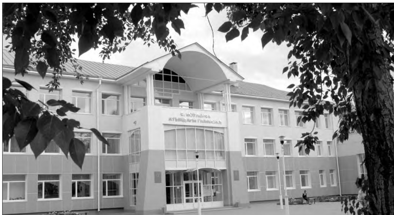
Мы не помним, что на этом месте располагалась школа штурманов