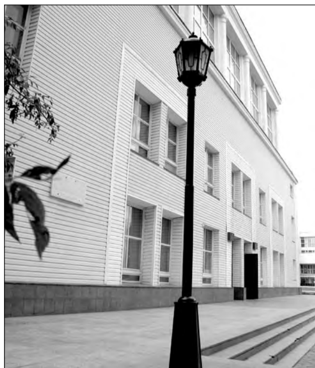
Здесь была площадь, с которой уходили на фронт бойцы Кустанайской бригады

Всё это лишь несколько эпизодов, исторических мазков из жизни нашего края, города Кустаная, а сколько значимого, причём не только для нас, здесь происходило в прошлом! Всё это пусть скромно, но просто необходимо обозначить на территории областного центра, а не задвигать, как целинный паровоз, на задворки. Всё это реальная, осязаемая связь веков и поколений. Город от этой мемориальной, осязаемой памяти станет только краше, мужественнее, величественнее. С юбилеями вас, кустанайцы!