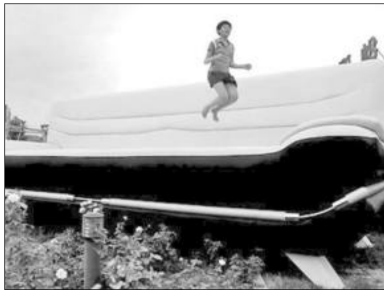
В Пекине установили гигантский диван. Чтобы построить этот восьмиметровый предмет интерьера, понадобилось десять дней