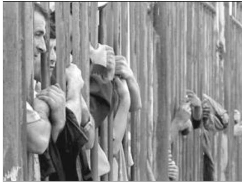
Прохожие смотрят на Черкизовский рынок в Москве, где в понедельник прогремел взрыв