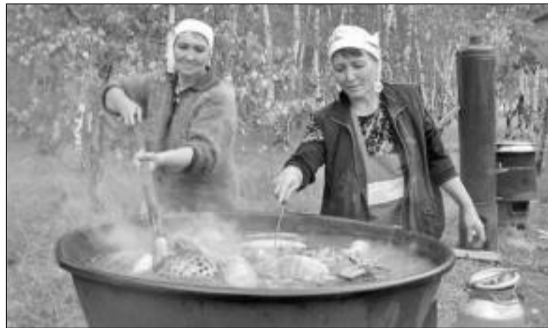
Мясо закладывали в казаны еще до рассвета

го утра на открытом воздухе варили мясо. Прямо на улице перед мечетью стояли огромные ёмкости с кониной и шужуком: от классических казанов до посуды размером с хорошую ванну.