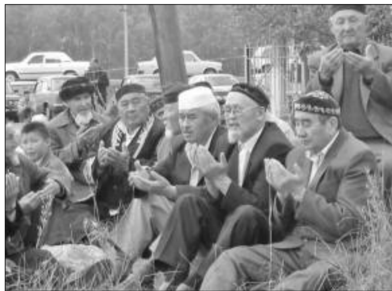
Намаз совершает около 1500 человек

Праздник в честь этого получился просто грандиозным. Гости, большая часть которых - потомки кажы, приехали не только со всех концов Костанайской области, но и из соседних российских областей. Готовясь к тою, в Сарыколе с само-