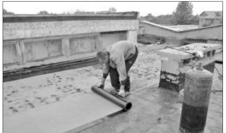
В школе-сад №1 классы уже переделаны в группы, теперь ремонтируют кровлю

Освободившиеся в школах-садах места займут дошколята. К 1 сентября классы там должны быть переделаны в группы, закуплена детская мебель. Ремонт, по словам Генриха Шека, идёт полным ходом. Из бюджета Костаная выделено 38 млн. тенге. Эти расходы