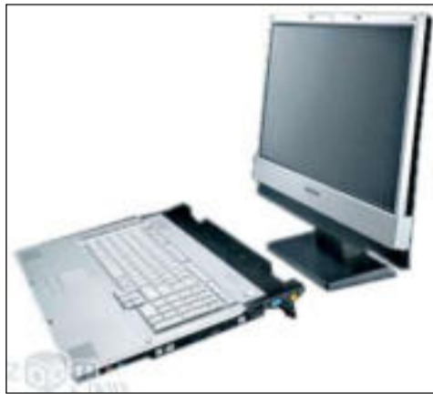
А на деле — гибридная компьютерная система с отделяемым ЖК-дисплеем

Совсем недавно инженеры компании Samsung создали ноутбук «M70», в котором матрица и клавиатурная половинка (а-ля системный блок) могут быть отделены друг от друга. Сразу заметим, что это не совсем обычный ноутбук, да и сама компания называет это творение LCD detachable hybrid computing system