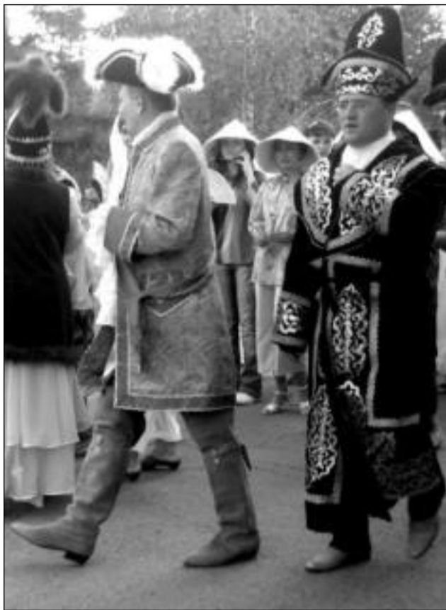
Бывший аким Лисаковска – в роли барона Мюнхгаузена, нынешний – в национальном казахском костюме