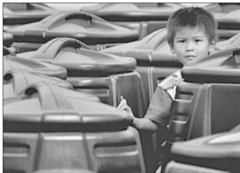
На Трафальгарской площади в Лондоне агитируют перерабатывать мусор. Один из поводов - в Британии продан тысячный бак для компоста