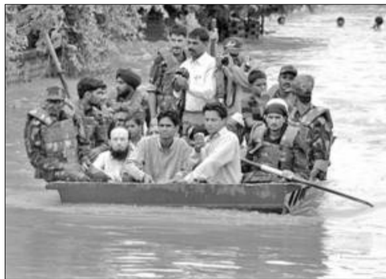
Индийские военные вывозят людей из затопленных домов в штате Гуджарат. Оттуда уже эвакуированы более 60 тысяч человек