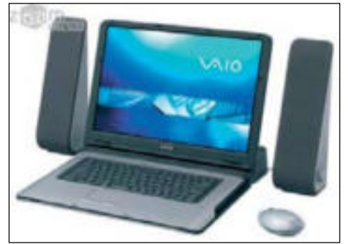
Система Hi-Fi обеспечит великолепный звук

Ещё одна субстанция, без которой трудно представить современный ноутбук, — это мультимедийность. Возьмём, к примеру, цифровое мультимедийное вещание DMB (Digital Multimedia Broadcasting). Компания LG уже представила первый ноутбук, который на ты с DMB-вещанием — LW40 Express. Правда, на сегодня это скорее дополнительная функция. По идее, этот стандарт мобильного телевидения изначально разрабатывался для мобильных телефонов, однако, согласитесь, что на 14-дюймовом дисплее всё выглядит гораздо привлекательнее. Смотреть телепередачи в любое время и где угодно — это просто здорово. И, кстати, можно не только смотреть, но и записывать. Но, конечно же, сегодня больше в ходу ноутбуки со встроенным ТВ-тюнером, позволяющие удобно просматривать «проводное» теле-