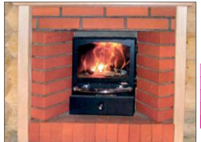
Топка, оформленная прозрачной дверкой и обложенная кирпичом, становится элементом декора

чем сухой, чтобы париться, вполне достаточно темпера-