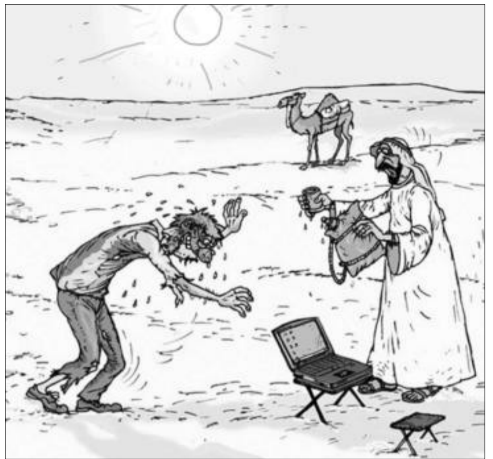
Жажда (карикатура Владислава Занюкова)

Жизнь, говоришь, не задалась? Горя вы не знаете!»