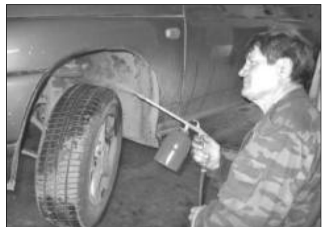
Антикоррозийную обработку лучше доверить профессионалам

Обработку мовилем желательно производить самостоятельно. Лучше, если это сделают мастера на СТО, поскольку у них есть специальное оборудование - распылители и шприцы для тщательной для обработки труднодоступных поверхностей машины. Самосто-