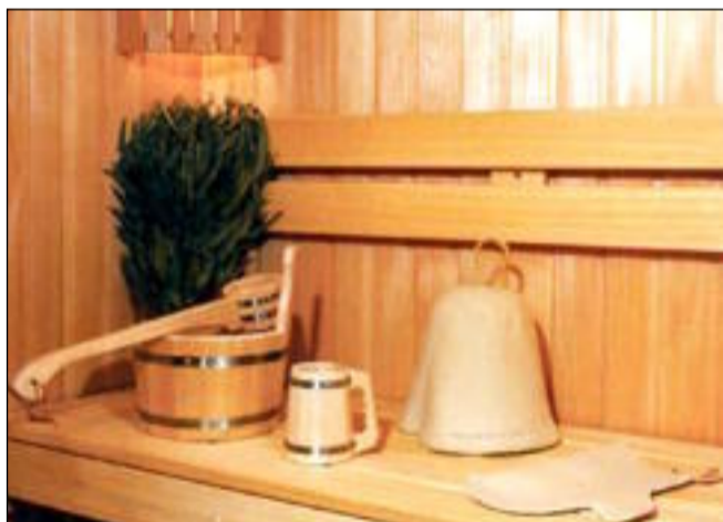
Оборудовать русскую баню в едином стиле - легко

Деревянный сруб стандартного банного размера 3x4 м обойдётся в 750 000 тенге. Внутренняя отделка «вылезет» ещё в 300 000-350 000. Наклейте ещё процентов 30-40, если работников для сборки вы будете нанимать, - и получите стоимость деревянной красавицы.