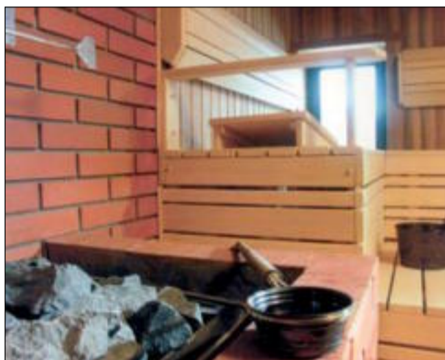
Камни вулканического происхождения в каменке служат дольше, чем речная галька

Деревянные шайки, ушата, черпаки – этот тот антураж, без которого деревянная красота не оживет. Стоит, кстати, недешево: в зависимости от ёмкости – от 3000 до 20 000 тенге.