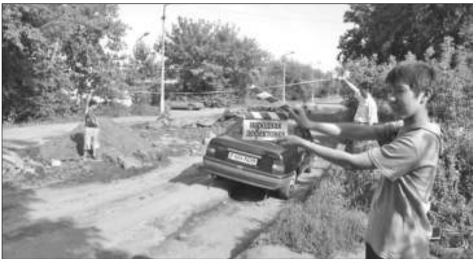
Костанай. Улица Победы

Когда образовалась эта яма, сейчас точно не скажет никто. Но её размер поражает воображение. Судите сами: длина - 54,5 метра, ширина - 14 м, глубина - 20 см. Мерили мы её вниз - от уровня оставшегося кое-где асфальта. Мерили и вверх. От той же отметки. В отдельных местах этот местный пик Победы возвышается до 1 метра 20 сантиметров! Очевидно,