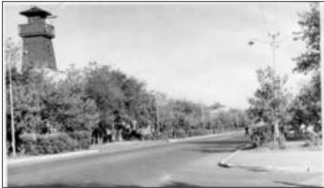
Так выглядел перекресток улиц Ленина (Аль-Фараби) и Советская (Байтурсынова) в начале 60-х. Напротив входа в городской сад – старая пожарная каланча

В 1959 году в городском парке – так его стали называть – отведена территория под строительство Дома пионеров. А в районе поймы Тобола, на месте бывшего питомника конторы благоу-