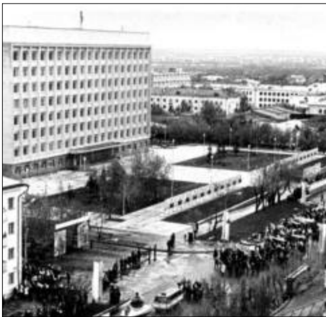
А это тот же перекресток 1 мая 1975 года. Справа – распланированный и обновленный городской сквер, на месте каланчи – площадь перед зданием обкома партии

ройства, Кустанайскому парку выделили земельный участок для разведения цветочного хозяйства.