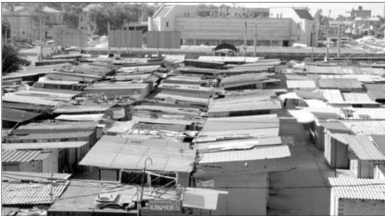
На этом месте в 1923 году был сад

*Десятина – русская поземельная мера. Размер казенной десятины был определен в 2400 кв. саженей (1,0925 га).