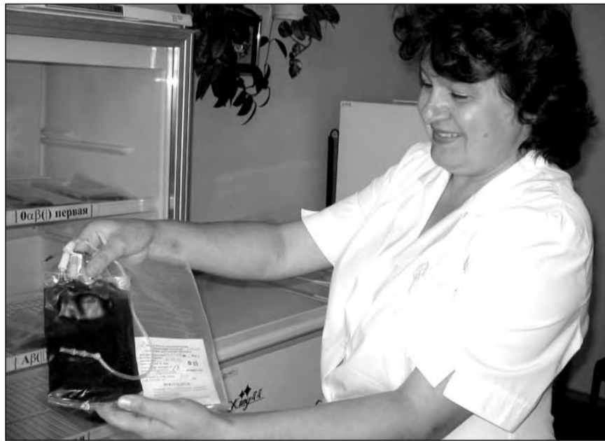
Так выглядит одноразовая упаковка с препаратом крови, на ней – паспортные данные крови и некоторые правила переливания