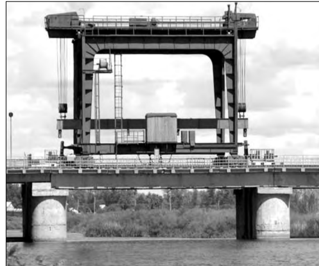
95% воды областной центр получает с этого водозабора

Новая задвижка стоит около полумиллиона тенге. По соседству с восстановленной стоят ещё три, которые тоже надо было сменить 20 лет назад. Но это полностью не ре-