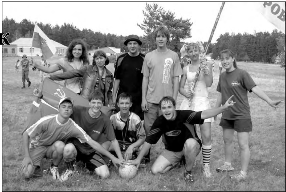
«Мы с Курганом – одна команда»

Пять дней в живописных окрестностях села Каменск-Уральского Мендыкаринского района проходил 4-й международный фестиваль молодёжи Костанайской и Курганской областей. В нём приняли участие более 140 человек, в основном студентов. В год Пушкина и Абая два гения двух братских народов незримо фестивалили вместе с молодым поколением. А организаторы праздника получили информацию к размышлению. Выяснилось, например, что для многих студентов вузов нашей области письмо Татьяны Онегиной стало открытием и откровением - итог сокращения программ по русской литературе в наших школах. А «Слова назидания» Абая ошеломили рос-