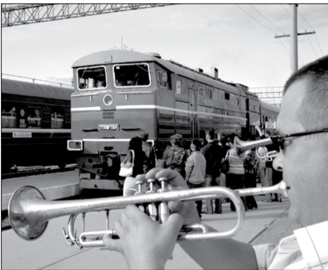
Костанайцы встречали «Турксиб» оркестром и цветами

- Президент «Казахстан темир жолы» Ерлан Атамкулов сообщил, что железнодорожников с 1 сентября 2006-го ожидает значительное повышение зарплаты. А с начала этого года машинисты и помощники машинистов локомотивов могут уходить на отдых в 59 лет. Все расходы до наступления пенсионного возраста берет на себя компания.