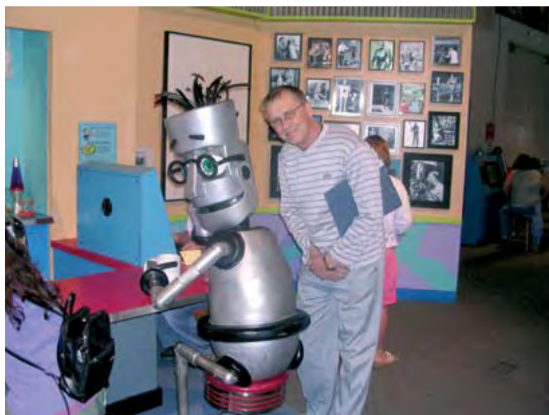
В орегонском музее науки и индустрии костанайцев встречал прадедушка современных роботов

- Вообще их немало, но, наверное, самая многочисленная и влиятельная бизнес-структура - это Ассоциация отраслей промышленности штата. Несмотря на название, туда входят не только промышленные предприятия. Членами ассоциации являются 20 000 компаний, где трудится бо-