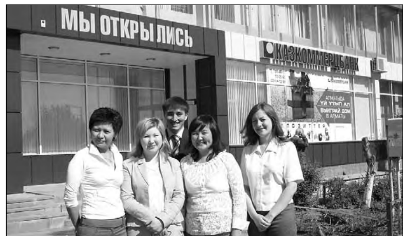
Теперь филиал Казкоммерцбанка есть и в районе КСК

Помимо прочего, АО «Казкоммерцбанк» делает для своих вкладчиков специальное, выгодное предложение: каждый клиент банка, открывший депозит в новом отделении на срок 12 месяцев, получает премию в размере 1% от суммы вклада.