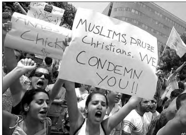
В Бейруте и во многих других городах мира в воскресенье прошли демонстрации протеста против военных действий в Ливане