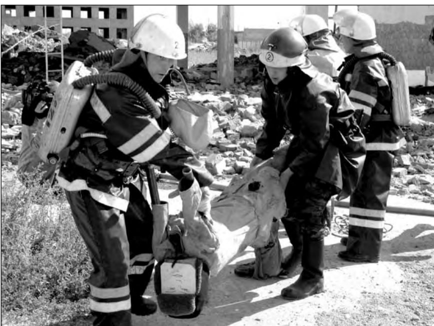
Эту «жертву» только что вытащили из-под завала

Вторым объектом учений стало полуразрушенное здание около химзавода. Там «горели» первый и второй этажи. Этот сценарий отработывали только пожарные СПЧ-2 Костаная. Здесь было найдено и спасено трое «пострадавших»: одного извлекли из-под плиты, второго - из колодца, третьего пришлось спускать на веревках с крыши. Роль жертв в котельной и возле химзавода успешно сыграли манекены.