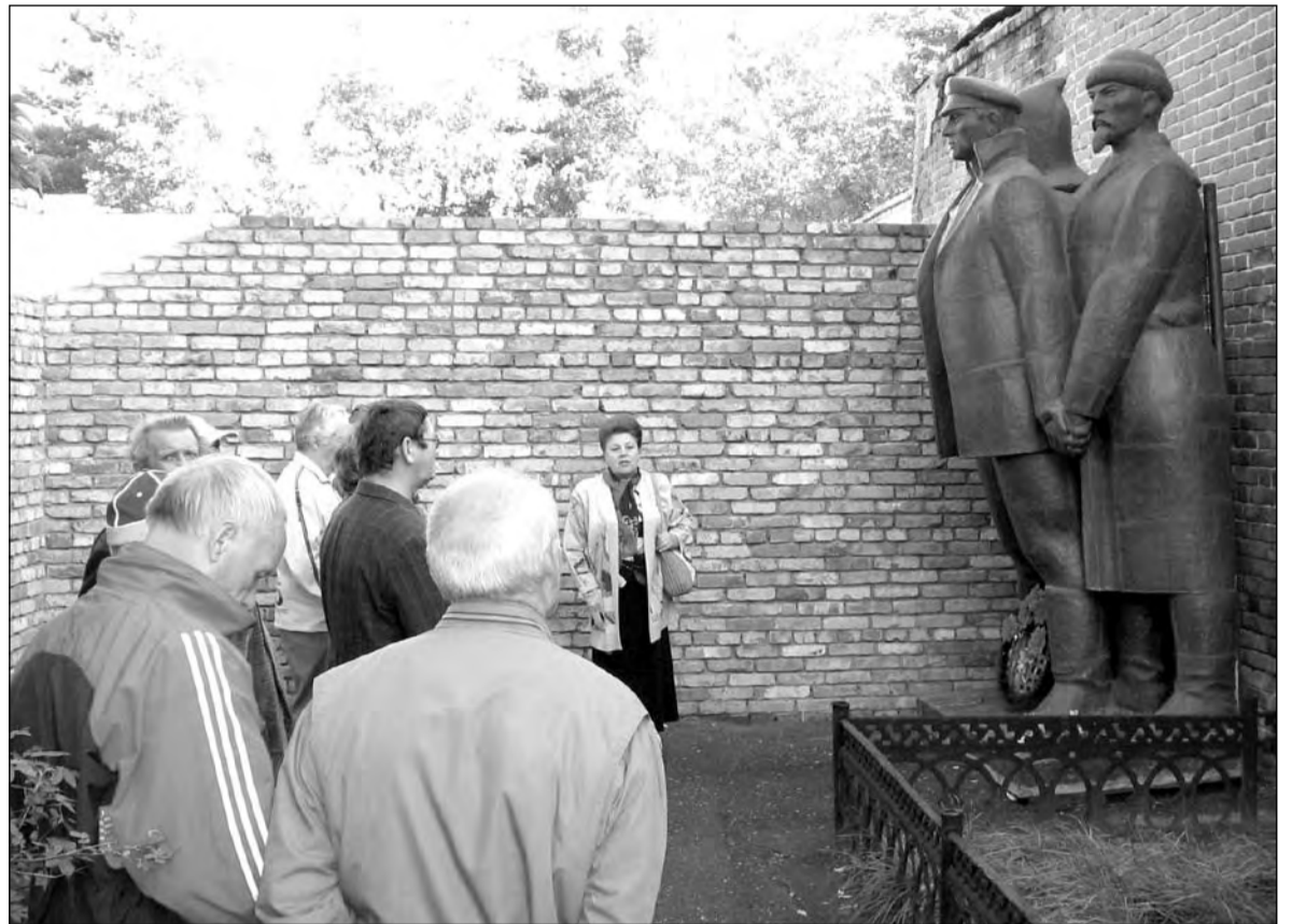
На Колчака повстанцы шли с оружием

Этот диагноз городу можно поставить с ходу, прямо на перроне вокзала, с которого виден печально зна-