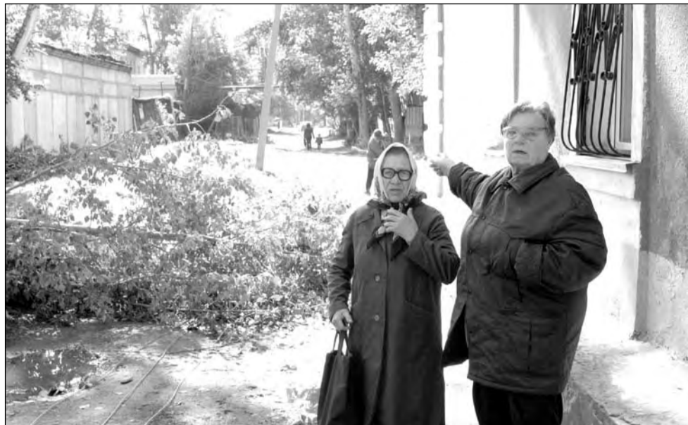
Жители этого костанайского дома оставались без света двое суток

На устранение аварии было направлено 6 бригад электриков. Бригада состоит из трех человек, поэтому лишь 18 специалистов восстанавливали свет по всему городу. По словам Кайрата Биболова, в первую очередь ремонтировали оборвавшиеся провода, которые валялись на земле, чтобы обезопасить людей от