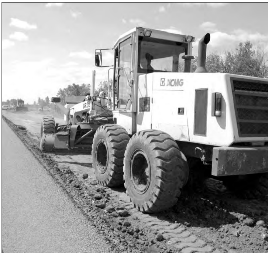
Реконструкция одного километра стоит 60 – 70 млн. тенге. Идёт ремонт аулиекольской трассы на отрезке между п. Затобольск и п. Мичурино

Надо думать, что всё это возможно при условии, если дефекты будут обнаружены своевременно. Способен ли на