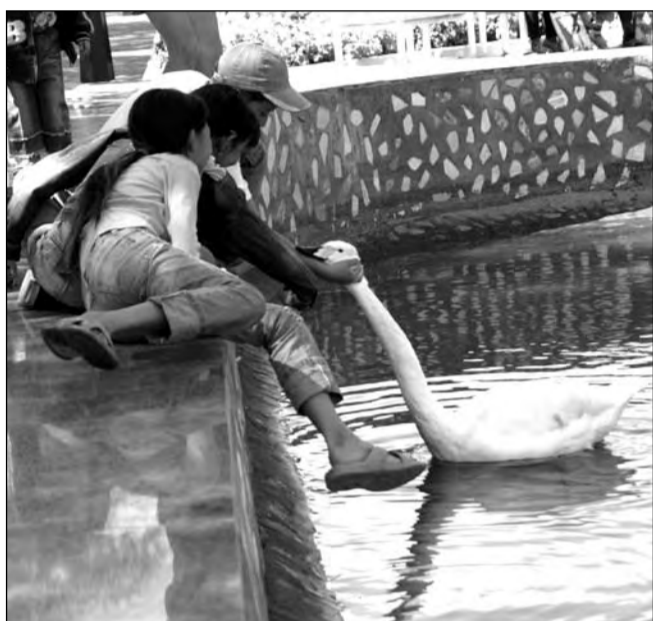
Возможно, место встречи «у лебедей» придется изменить