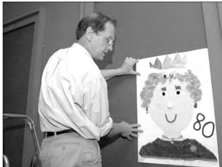
В Букингемском дворце открывается выставка поздравительных открыток, которые королева Елизавета II получила в связи со своим 80-летием