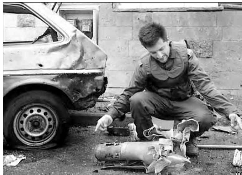
Израильский солдат осматривает остатки ракеты, запущенной из Ливана боевиками Хезболлы