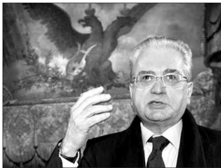
Директор Эрмитажа Михаил Пиотровский сообщает журналистам, что украденные из музея шедевры не были застрахованы