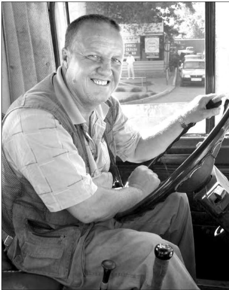
«Интересно, захотят ребята прокатиться на кране?»