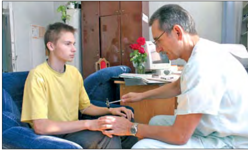
Расскажите врачу о всех симптомах, которые вас беспокоят

Честно говоря, сведения о разнообразии инсультов даны лишь для того, чтобы настроить читателя на серьезный лад. Плохо и страшно все, что связано с нарушением мозгового кровообращения. Спасти человека если не от смерти, то от инвалидности с тяжелыми параличами, невнятной речью или отсутствием оной, потерей памяти может только своевременная медицинская помощь. Особенно,