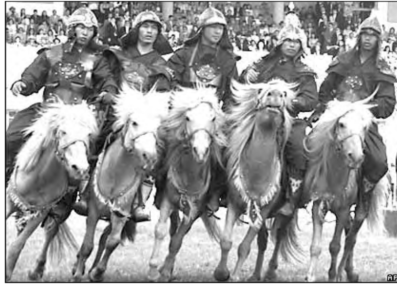
В Монголии проходят торжества по случаю 800-летней годовщины завоевательного похода Чингисхана