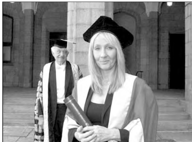
Писательница Дж. К. Роулинг, автор книг о Гарри Поттере, получила почетный диплом Абердинского университета