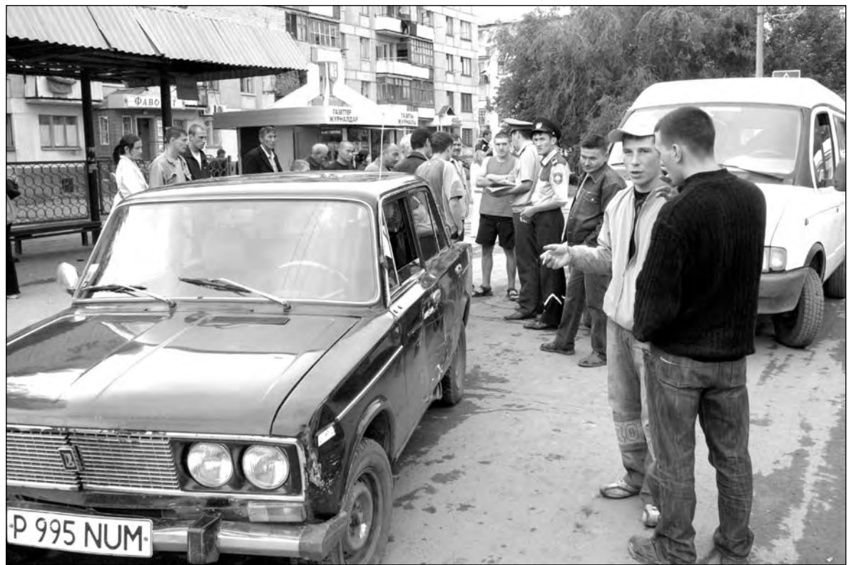
Никто не хотел уступать. Теперь разбирается дорожная полиция

Двигаюсь по первому ряду, проезжаю пешеходный светофор у Дома печати и... упираюсь в иномарку. Ее водитель включил аварийную сигнализацию и спокойно прохладается под знаком «Стоянка запрещена», ожидая своего пассажира, забравшего «на минутку» в городской налоговый комитет. Выехать во второй ряд мне мешали «сорвавшиеся с цепи» у светофора машины, за мной уже начала выстраиваться колонна, задние все сигналят, проклиная мою нерешительность.