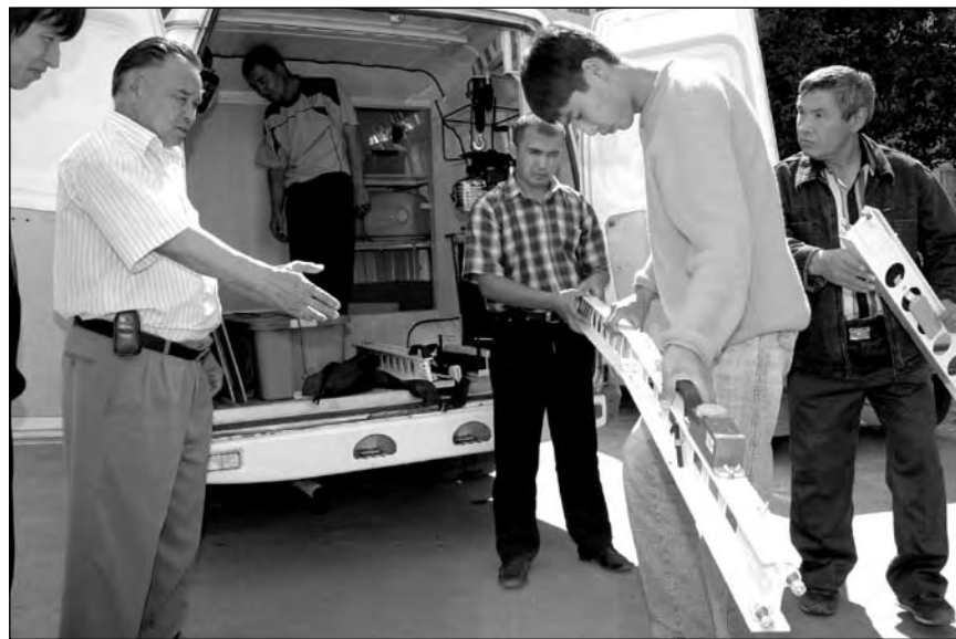
Контроль за качеством станет мобильным...