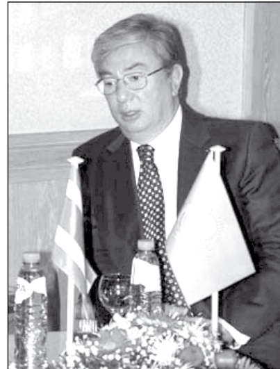
Касымжолмарт Токаев: «Казахстан достоин возглавить ОБСЕ. Но когда?»

На прошлой неделе Нурсултан Назарбаев подписал поправки в Закон «О СМИ», которые назвал «реакционными» даже первый вице-министр иностранных дел Казах-