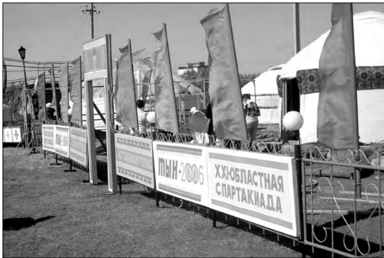
Городок из юрт расположился в центре Аркалыка, у искусственного водоема

На эти дни в город прибыло более 2 000 гостей, половина из них – спортсмены. Фавориты конных состязаний на ипподроме – команда РКП «Казак тулпары» из поселка Заречный в составе 21 спортсмена и 18 скакунов. Помимо национальных конных игр, здесь пройдет байга на четырех разных дистанциях.