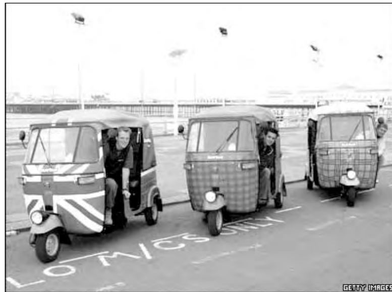
В английском городе Брайтоне появились передвижные средства так-так, которые очень популярны в Индии в качестве такси