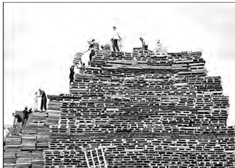
В Белфасте готовят огромный костер – один из сотен, которые зажгут по всей Северной Ирландии протестанты из организации Orange Order