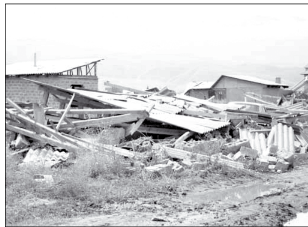
Всё, что осталось от бакаевских «саманок»

лицейских окружили микрорайон и полностью нейтрализовали любые попытки противостоять разрушению домов. Задержав около 40 человек, четверо из которых оказали полиции жёсткое сопротивление, представители правоохранительных органов дали команду водителям бульдозеров начинать рушить саманные постройки. В первую очередь были снесены те 30 домов, которые подлежали сносу на основании решения Турксибского районного суда города Алматы о незаконном захвате земли и строительстве. Остальные несколько сотен домов, судя по высказываниям отдельных представителей властей, стали разрушаться на основании распоряжения акимата Алматы. В результате свыше двух