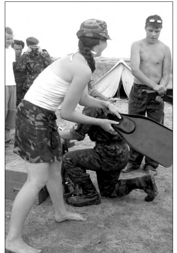
Церемония посвящения в «пузыри»

до неприличной длины – с фалангу пальца взрослого человека. «Рудненской породы», – веселились обитатели лагеря, интенсивно почесываясь. Между тем «Комарэкс» не приветствовался. Народ предпочитал выживать в естественных условиях.