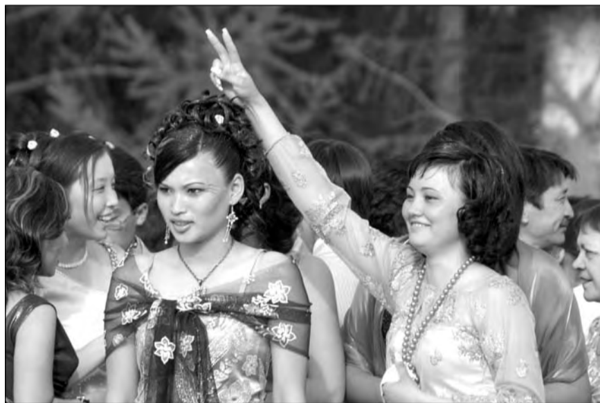
Внимание: фото на память