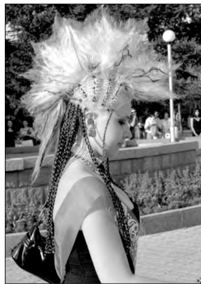
Самая экстравагантная выпускница