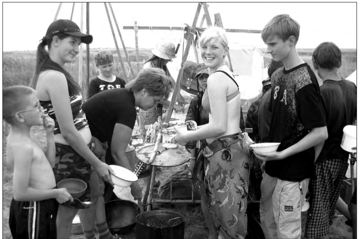
На обед обитатели лагеря ели борщ и пили компот из сухофруктов

В перерывах между непогодой лагерь непрерывно атаковали комары. Большой Водолазный окружен камышом, речной водой и болотом. В этих условиях комарики выросли