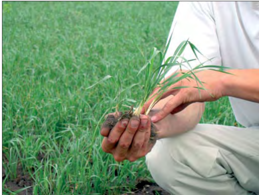
Каждый росток должен быть застрахован