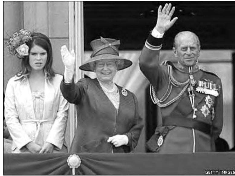
Великобритания торжественно отметила официальный день рождения королевы, которая на самом деле родилась в апреле. Такова традиция...