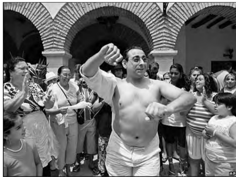
Танец живота доступен всем! Цыгане собираются в одной из деревень Испании в честь праздника Богородицы