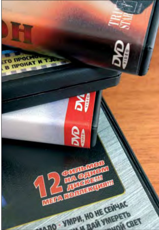
12 фильмов на одном диске? Гарантированный показатель пиратского происхождения

Конечно, бывает и так, что пиратский диск по качеству записи не уступает лицензионному. Но, как правило, сэкономив 1 000 тенге на покупке лицензионного диска, вы по-