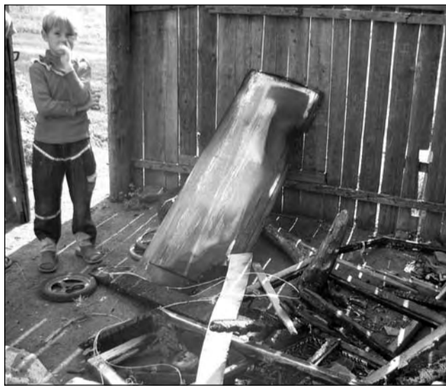
Соседи до сих пор не придут в себя от шока: вместе с бараклом в доме горели дети

Мальчишки-одноклассники сегодня героями себя, похоже, не считают. Да и в поселке, который буквально гудит от негодования по поводу нелепости трагедии, как-то о пацанах гово-