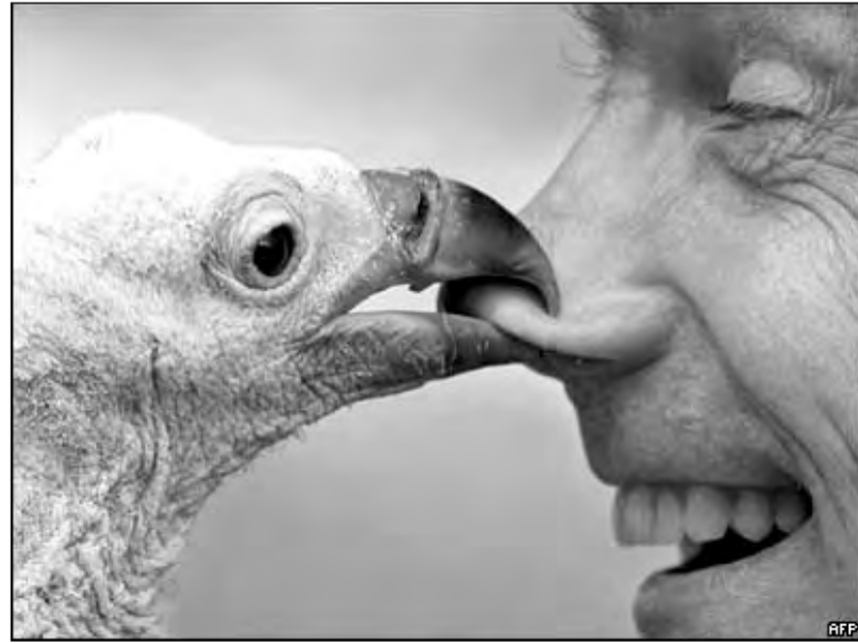
Этот юный грифон появился в Ганновере из яйца, вывалившегося из гнезда. Родители его не признают, так что птицу растят сотрудники зоопарка