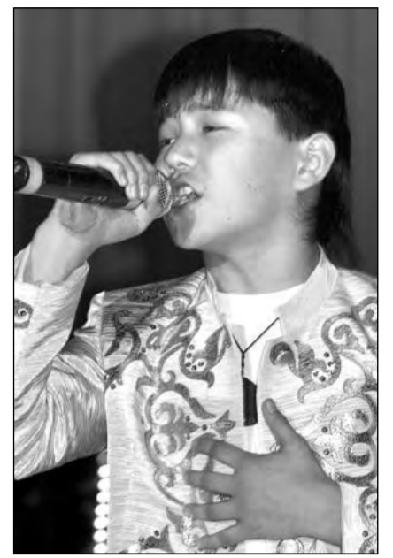
Его голос покорило международное жюри

Только вот испанского успеха могло и не случиться. 250 000 тенге - столько требовалось для поездки и выступления. Спонсоров, к сожа-