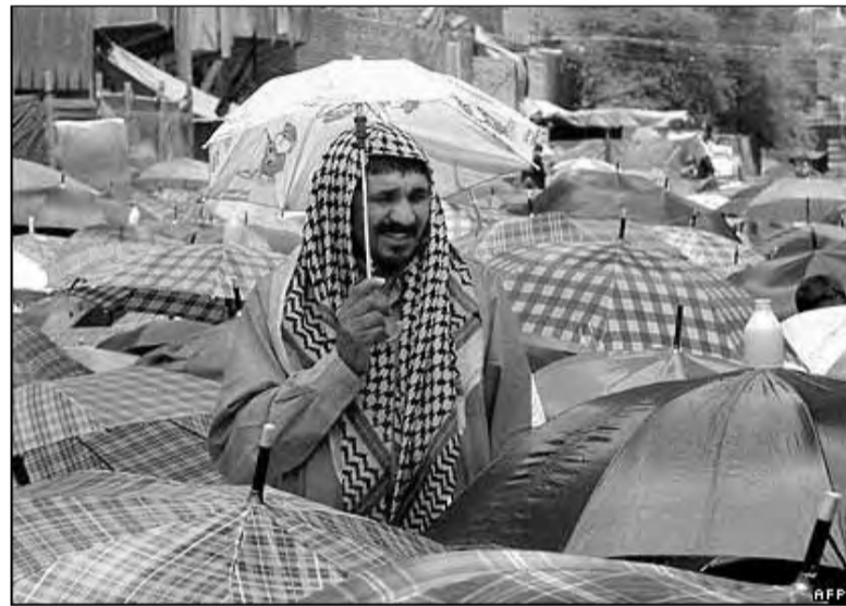
В Багдаде – невыносимая жара, но пятничные молитвы никто не отменял