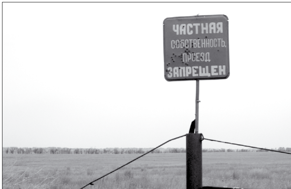
Понадобятся ли нам таблички «Общедоступная территория. Въезд разрешается всем»?

Ясно, что приват-территории разного назначения располагаются не только вокруг Костаная. Процесс, что называется, идет. Не можем ругаться за достоверность, но, например, в Мендыкаринском районе народ утверждает, что в самом красивом месте – в окрестностях бывшего совхоза «Каменск-Уральский» – при-