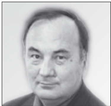
Бексулган ТУТКУШЕВ, депутат Сената Парламента РК:

– Использование территорий, в которых могут располагаться места отдыха, в Казахстане регулируется Земельным, Водным и Лесным кодексами. Что касается земли, на которой построены какие-либо сооружения, находящиеся в частной собственности, то и она должна быть в частной собственности. Другое дело – земля в природоохранной зоне у водоемов и в лесном фонде. Она должна быть в государственной собственности. Что касается строительства на ней каких-то капитальных строений, то тут надо решать в каждом конкретном случае отдельно. По-моему, в Лесном кодексе, в частности, предусмотрены какие-то положения разрешительного характера. Но земля в этих зонах, я считаю, должна быть все-таки государственной.