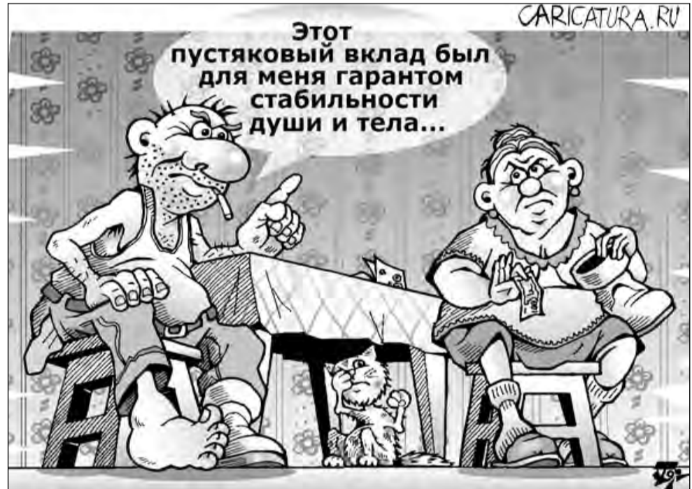
Крах фонда (карикатура Петра Тягунова)

Одеколон «Верность» не только спасёт вашу квартиру от тараканов, но и убержёт вашего мужа от случайных связей!