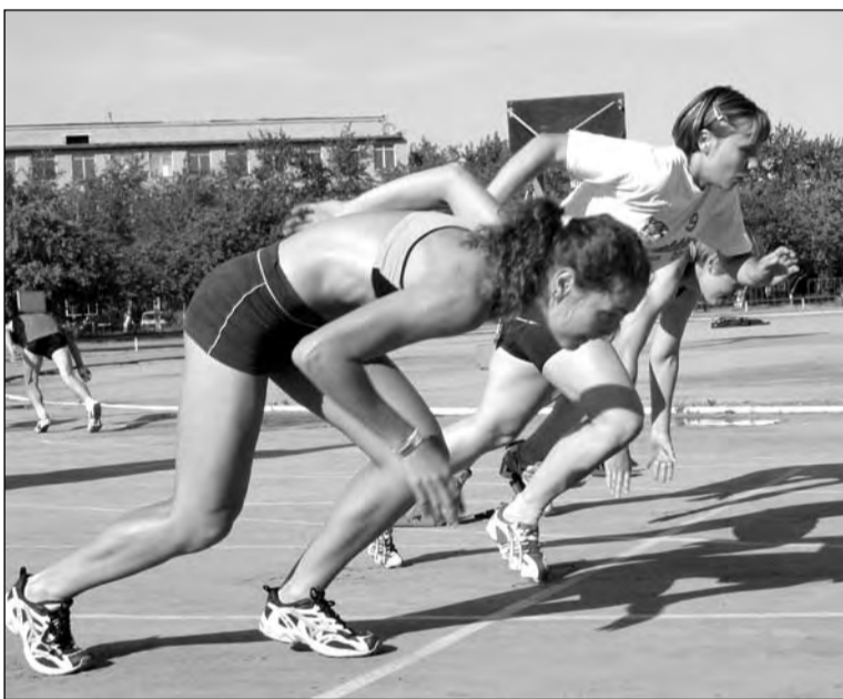
Один из четырех видов многоборья — бег на 100 метров

Горожане проведут финальные состязания в Аркалыке в июле.