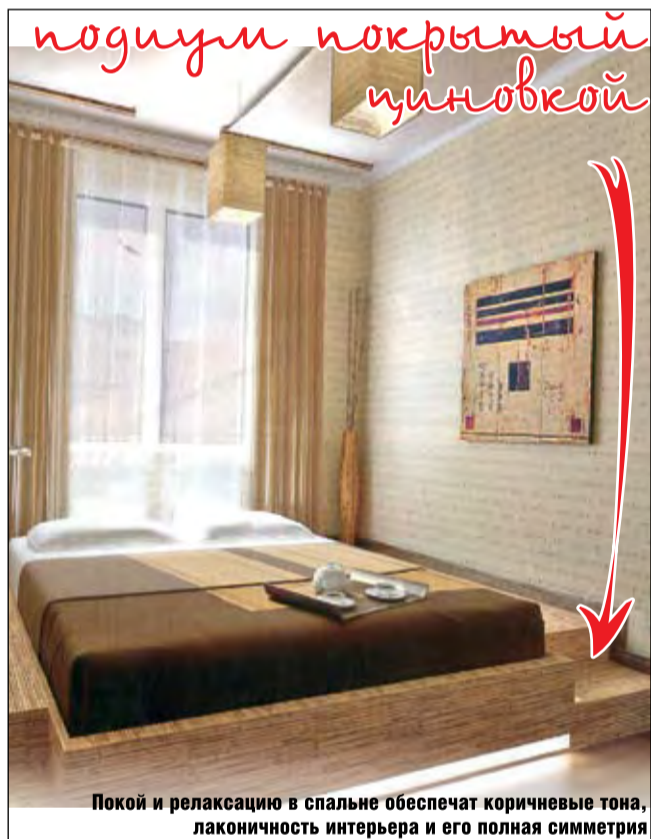
подиум покрытый циновкой