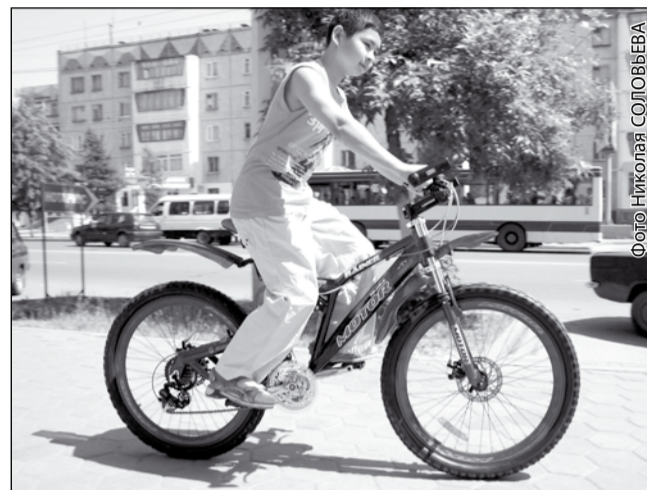
Горный велосипед хорош и для города

У горных и экстремальных велосипедов диаметр колеса 26 дюймов, у прогулоч-