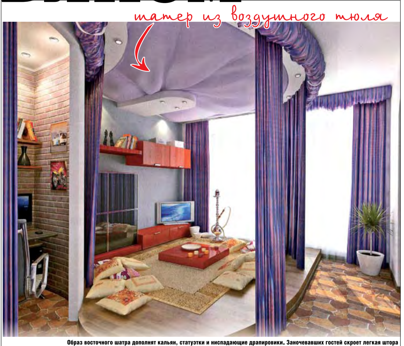
шатер из воздушного тюля