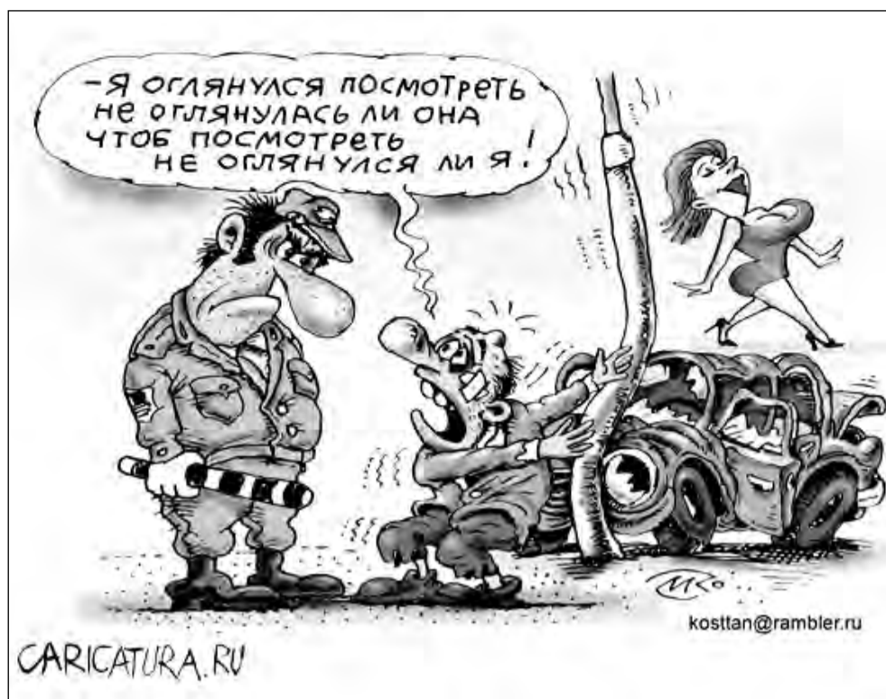
Винючник ДТП (карикатура Константина Мальцева)