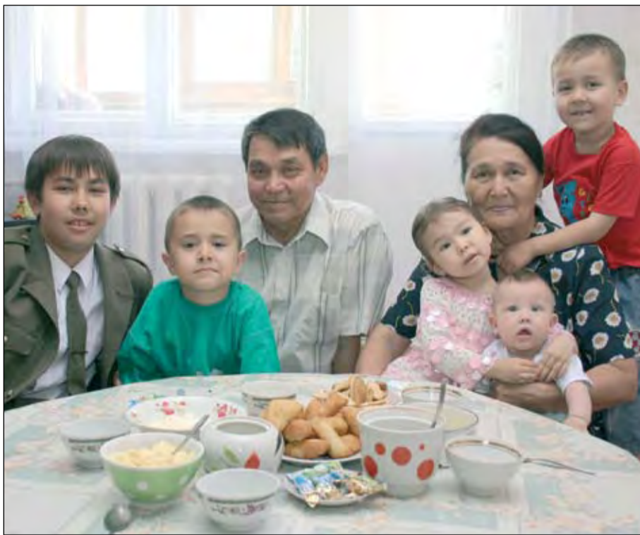
«Мы в своих внуках души не чаем»

Историю и фото нужно доставить по адресу: Костанай, Майлина, 2/3, редакция «НГ» . Можно отправить фото и текст по электронному адресу: ng@ng.kz .