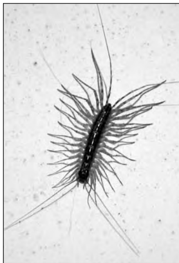
Этот ужас на тридцати ножках может приносить пользу

В наших квартирах пищей для скутигеры становятся практически все насекомые, которые так нам досаждают. В некоторых южных странах их даже оберегают, цена вклад по уничтожению кровосо-